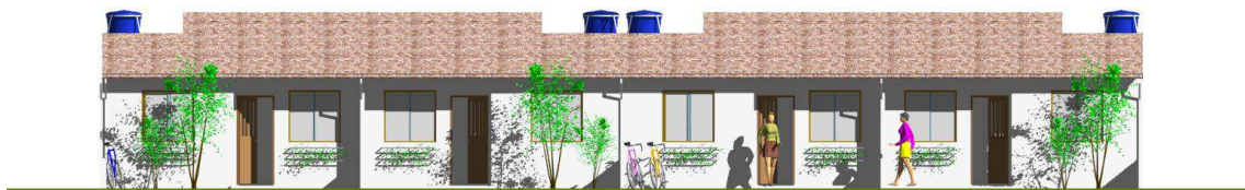
Vista de una sección de aspecto urbano de casas MUHOGAR en ubicación apareada

Estas casas también deben considerar factores bio climáticos y estéticos, no es justo que se pretenda poner a vivir a los pobres en pobres barriadas, con pobres casas para que vivan pobres toda su pobre vida. Evitémosles la incertidumbre de una vida en obra negra