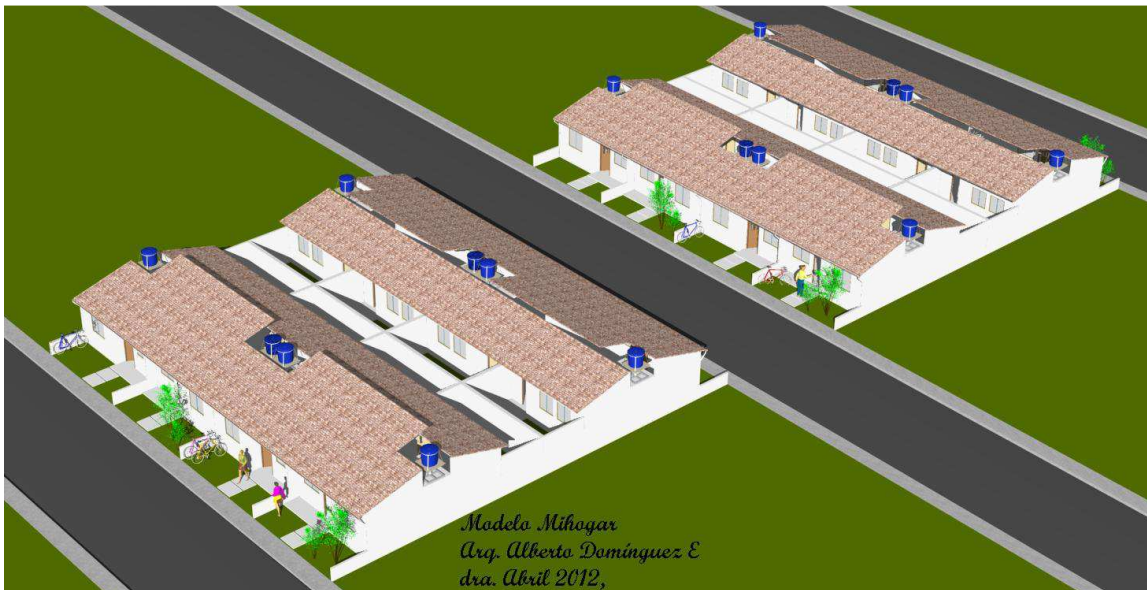
Vista de una sección urbanizada

Sr(s, as), hora sí que podemos hablar sobre temas conocidos, Ya que este asunto da mucha ganas de participar. CASAS GRATIS , vea UD, la mejor solución que se le puede dar a una familia de "0" ingresos, generalmente desplazada por la guerra interna que vive el país o por causa de catástrofes naturales o por la idea de un gobierno paternalista que está dando plata o por aquellos deseos de dejar todo en busca de algo mejor, total, gentes de todas la regiones que se refugian en los rincones y esquinas de las ciudades más importantes del país a limosnear con el afán de hacerse con una mejor calidad de vida, cantidades de ellos adultos y niños, tirados en las calles o paseándose entre el tráfico vehicular con destartalados carteles que se asume narran su desgracia. ¿Cómo darle a estas desfavorecidas unidades familiares una vivienda propia? Y que además cumpla con todas las expectativas que se hubieren podido haber generado con la idea de que el Este Gobierno tiene plata y tienen que darnos lo que le pidamos. Se debe estar preparado para capotear estas y otras solicitudes exageradas que se han de presentar, ya con solo hacer el Gobierno el anuncio de su propuesta, han aparecido cientos de detractores que se ufanan de opinar sobre el triste final enredado de esta oferta. Yo no creo que eso pase, y por ello estoy desarrollando este proyecto que he denominado modelo de casa MIHOGAR a 29 Millones c/u