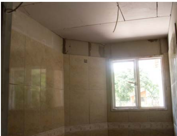
Baño auxiliar en proceso de enchape