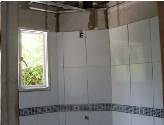
Baño principal en proceso de enchape