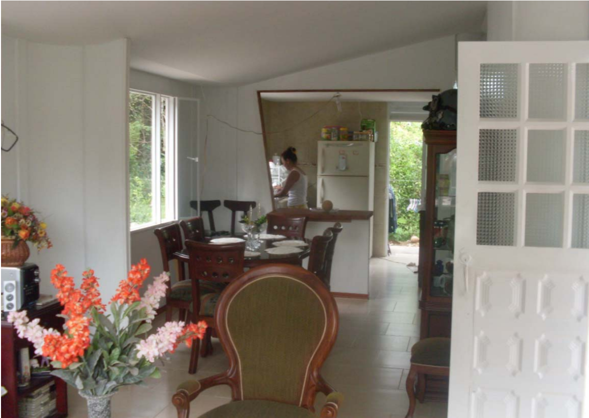
Vista del área social y cocina