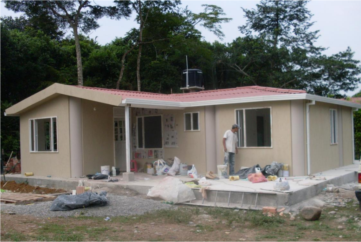
VISTA LATERAL POR EL PORCHE DE ACCESO