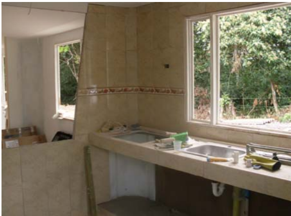
Cocina abierta tipo americano