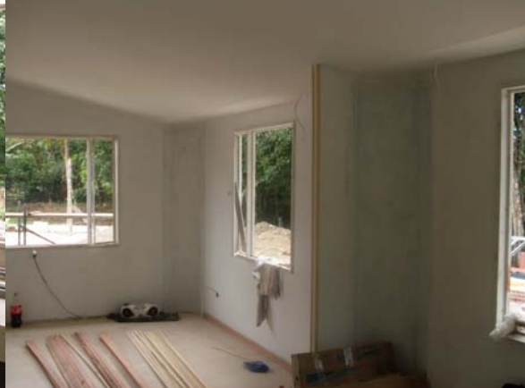
Interior del salón y comedor